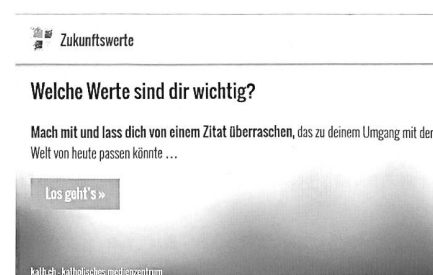
Psycho-Test «Zukunftswerte»

Nebst dem Thema «Homosexualität» geht es um Situationen aus den Bereichen Frauen in der Gesellschaft, Europa und Islam, Tradition und Veränderung, Ethik, Säkularität und Verhütung. Am Ende des Fragebogens folgt eine kurze Einschätzung der Person sowie ein dazu passendes Zitat, das als grafisch gestalte-