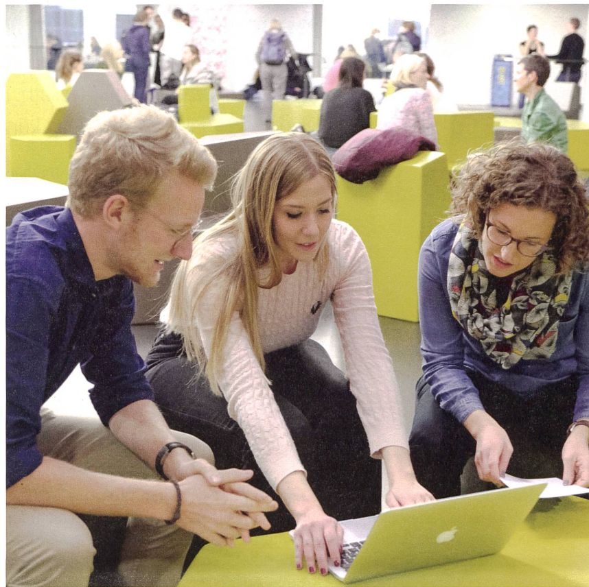
Studierende am Religionspädagogischen Institut Luzern (RPI).

Das Studium der Religionspädagogik ist zudem anschlussfähig und bietet denen, die möchten, weitere Optionen zur Weiterentwicklung, zum