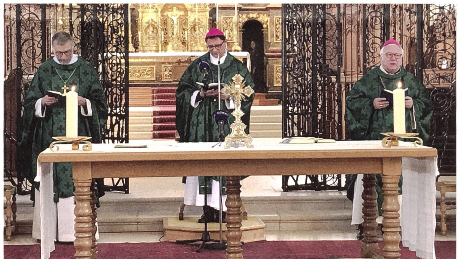
Gottesdienst während der Versammlung der Schweizer Bischöfe in Mariastein.