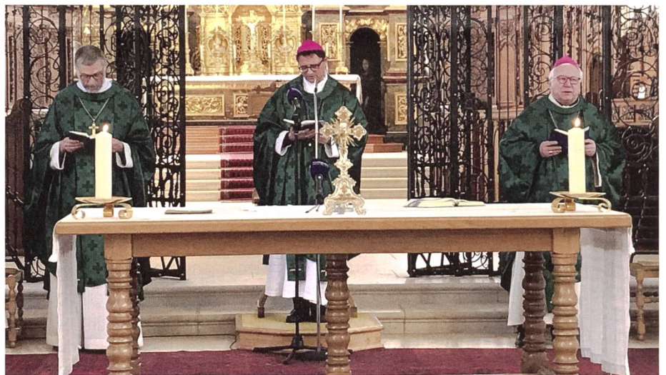
Gottesdienst während der Versammlung der Schweizer Bischöfe in Mariastein.