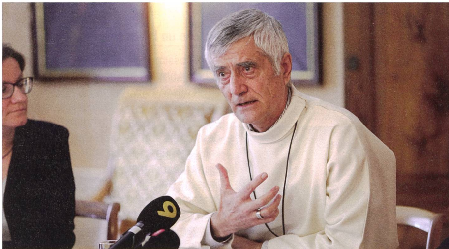
Jean-Marie Lovey, Bischof von Sitten

Aus der Sicht des Bischofs droht die begleitete Sterbehilfe «zu einer gesellschaftlich anerkannten Dienstleistung» zu werden. Aus christlicher Sicht könne eine solche «Dienstleistung» aber keine Unterstützung erfahren. Sie stelle vielmehr einen schweren Angriff auf das Leben des Menschen dar. Ein Priester könne durchaus einen Menschen begleiten, der um Sterbehilfe gebeten habe. «Sie sollten nicht ausgeschlossen werden. Das wäre inakzeptabel.» Man müs-