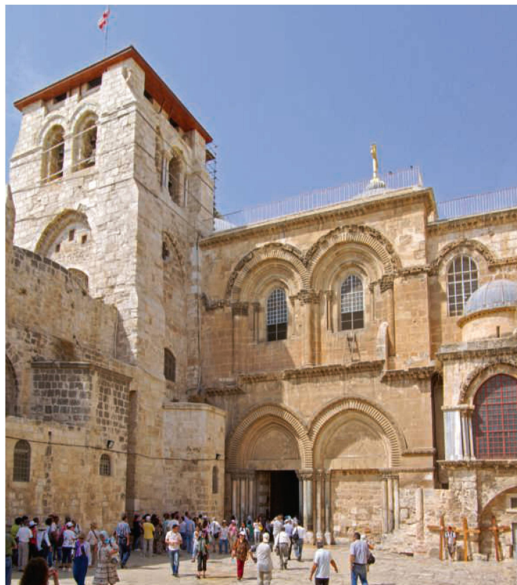
Grabeskirche in Jerusalem.

Obwohl der Weg nicht einfach das Ziel ist, so ist der Weg doch von zentraler Bedeutung. Johannes vom Kreuz empfiehlt, sich allein und zu Fuss aufzumachen. Der Pilgerweg ist nämlich ein spiritueller Übungsweg, geprägt von Gebet und Verzicht, von innerer Transformation und Ausrichtung auf Gott. So liess gerade mein Pilgern nach