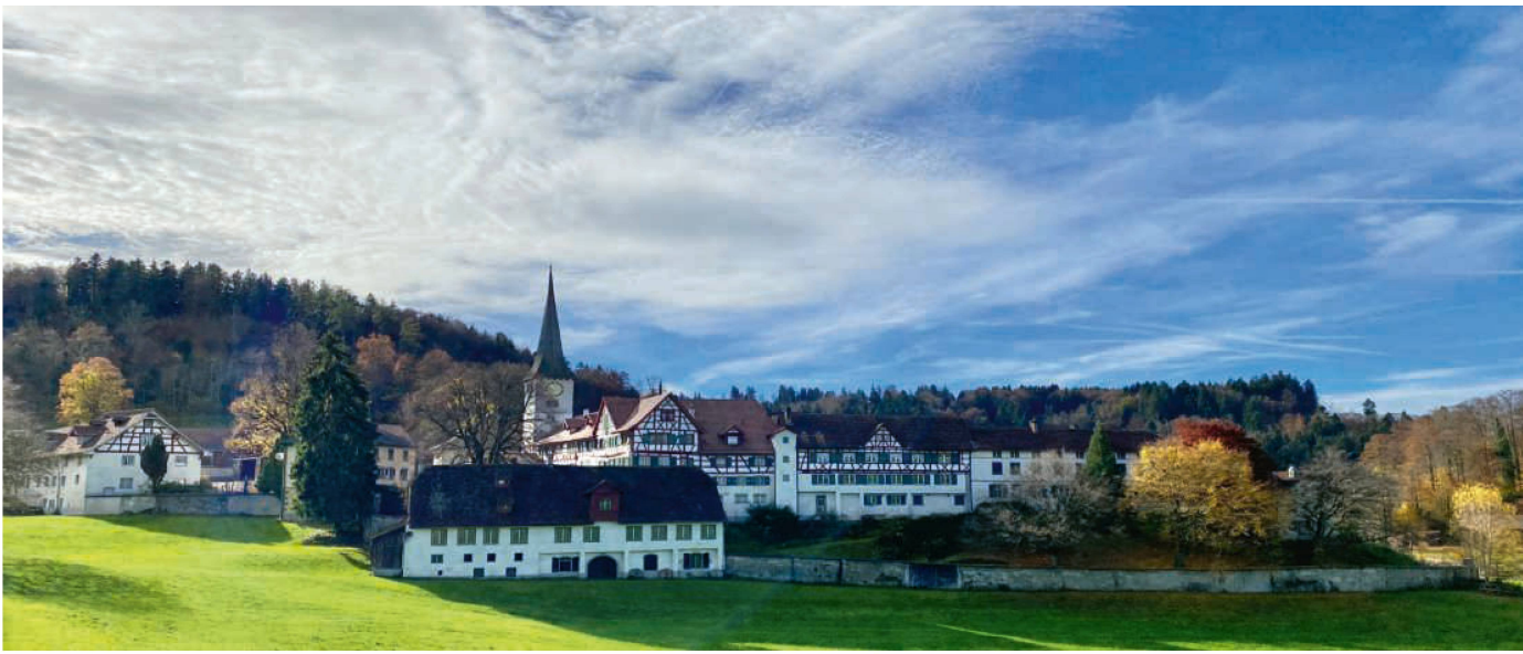
Etappenziel Kloster Magdenau, eine Zisterzienserinnenabtei in der Ortschaft Wolfertswil, Gemeinde Degersheim SG.

verstanden haben, welchen Eindruck der heilige Kolumban auf die Bevölkerung gemacht hat, sein Eifer in der Verkündigung und seine innige Gottverbundenheit.