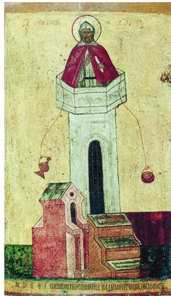
Nicht nur Orte oder Gräber waren Ziel der Pilgernden, sondern auch Heilige wie Symeon der Stylit. Ikone aus dem Jahr 1465.