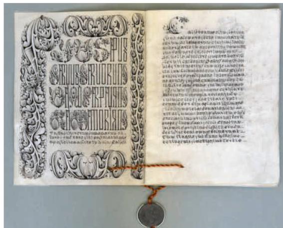
Ein Blick in die Geschichte: die Reorganisationsbulle von 1847. Darin wird unter anderem das besondere Vorrecht des St. Galler Domkapitels geregelt, den neuen Bischof zu wählen.

Verglichen mit anderen Diözesen ist das Bistum St. Gallen mit 175 Jahren noch jung. Auch in der verhältnismässig kurzen Zeit standen die Katholikinnen und Katholiken in den Bistumskantonen St. Gallen und beiden Appenzell immer wieder vor neuen Herausforderungen und entscheidenden Wendepunkten. Eine Festakademie mit Referaten, Impulsen und Podiumsdiskussion thematisiert die geschichtliche Entwicklung, die Gegenwart und die Herausforderungen der Zukunft.