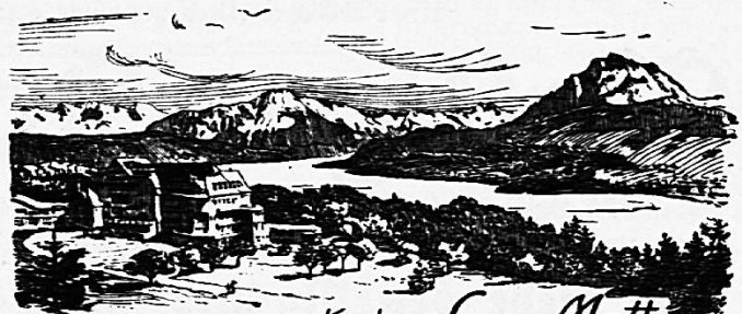
Kurhaus Sonn-Matt Luzern. 600 M ü. M.