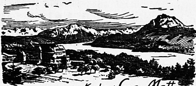
Kuchhaus Sonn-Matt Luzern. 600 M. M.