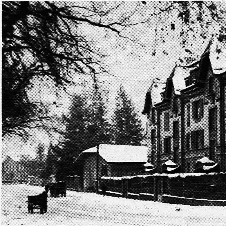
Wohnhaus während den Jahren der stärksten öffentlichen Tätigkeit an der Laupenstrasse 51, Bern. 1916/17 ständiges Sekretariat des Aktionskomitees zur Erlangung des Frauenstimmrechts in Gemeindeangelegenheiten.