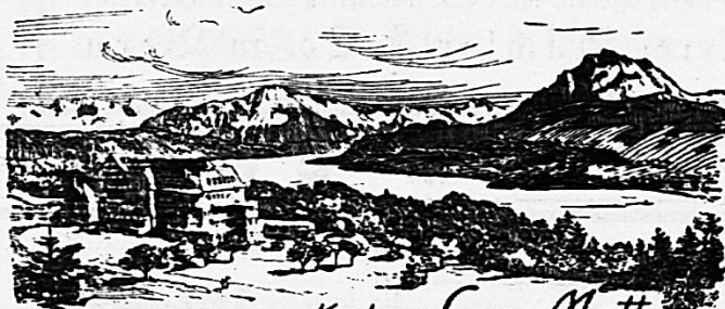
Kurhaus Sonn-Matt Luzern. 600 M. ü. M.

Français. / Toutes branches ménagères. (Près Neuchâtel) 632