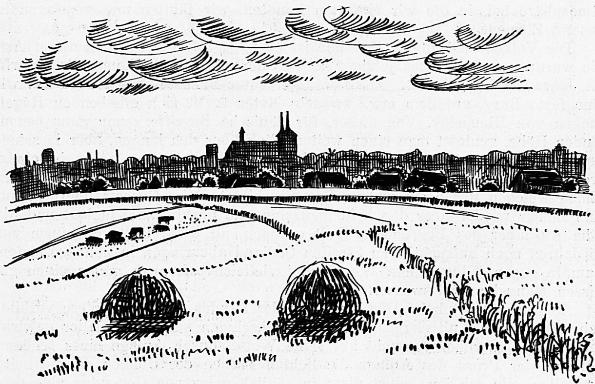
Stadt und Dom von Roskilde