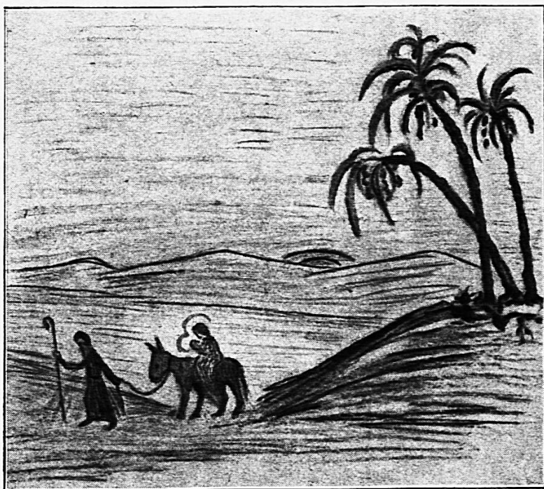
«Flucht nach Ägypten» nach eigener Phantasie entworfen und ausgeführt von Hedwig Morf (12 Jahre), Aarburg

Winterwald», geht etwas ins Märchenhafte; die vielen Tiere (vielleicht stand der Legendengedanke im Hintergrund, daß den Tieren in der Heiligen Nacht die Sprache gegeben wird), die sich neigenden Tannen und der reizende Phantasiebaum (links im Bilde) weisen darauf hin. Die ganze Zeichnung zeigt besonders schön die beschwingte, festliche Verfassung des Kindes in der Vorweihnachtszeit. Beinahe entsteht in uns die Versuchung, über das, was die Zeichnung durch die Stimmung in uns weckt, hinauszu-gehen und auf den jungen Menschen zu schließen.