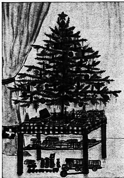
«Weihnachten», Farbstiftzeichnung nach Phantasie von Rolf Eisenring (12 Jahre), Bern

Das letzte Bild, ein Linolschnitt, wurde von einem 12jährigen Knaben geschaffen. Hier ist das Naiv-Kindliche, verbunden mit einer schon künstlerisch