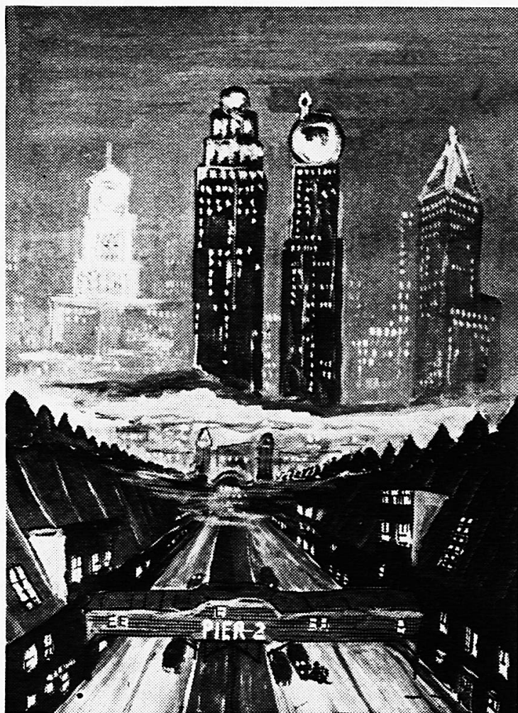
Knabe, 16 Jahre, USA Chicago Deckfarben auf Papier (Pestalozzianum Zürich)

Jahren ein wahrer Farbausbruch stattgefunden hätte und als ob nichts anderes als Farbe zu schönen und guten Bildern verhelfe. Ja es ist eine Befreiung zur Farbe geschehen innerhalb kurzer Zeit, und jeder Lehrer wird heute seinen Schülern gerne die Möglichkeit bieten, dieses Mittel zu benützen, denn das Kind hat eine unmittelbare, gefühlsbetonte Beziehung zur Farbe und wird sich ihrer auch in diesem Sinne bedienen. Auch liefern die Farbfabriken neue, farbkräftige Produkte, so daß dem Kinde gemäÙes Material beschafft werden kann. Aus dieser neuen Freude heraus ist die Kollektion für Lund so farbenfroh beschickt worden. Unmöglich ist es, die einzelnen Gruppen zu schildern, geschweige denn einzelne Arbeiten hervorzuheben. Jeder Besucher wird die Bilder nach seinen Gesichts-