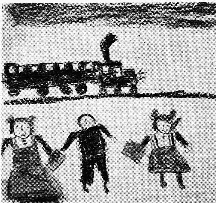
7 Jahre, Norwegen, Lofoten Reisende Farbstift auf Papier (Pestalozzianum Zürich)