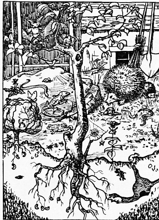
Nr. 562 Tiere im Garten, Format A 5, 8 Rp.

Nr. 563 handelt von den SBB, Format A 4, 15 Rp.