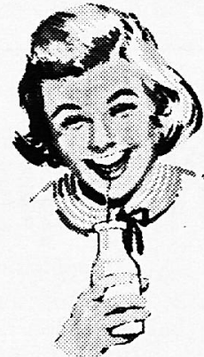
PZM / Rischik / B II

Schreiben Sie für Gratismaterial an PZM Bern (Kurzadresse genügt)