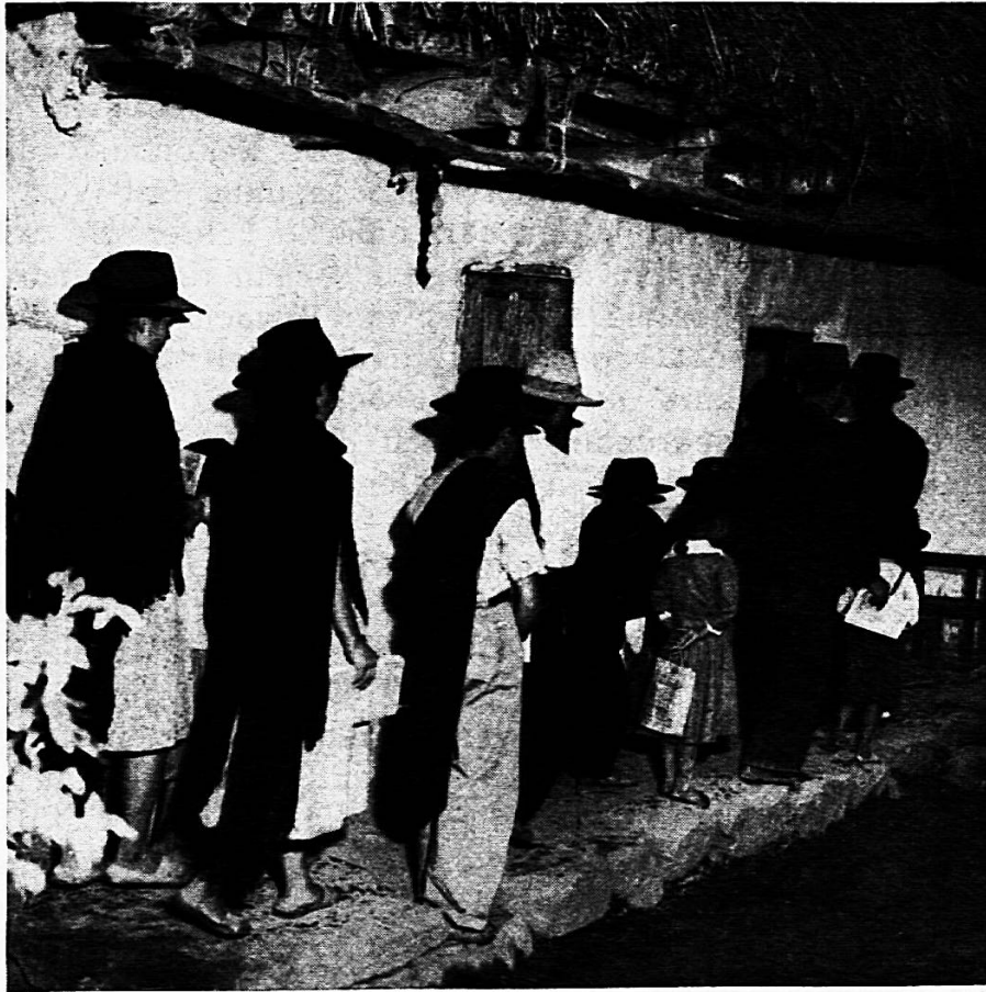
Erwachsene und Kinder in Columbien — alles Analphabeten — möchten gerne lesen, schreiben und rechnen lernen.