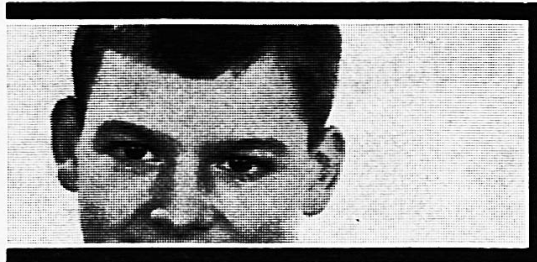
Talens & Sohn AG Olten

Mit einem TALENS-Farbkasten werden die Kinder zu begeisterten Malern