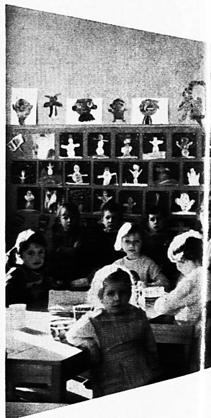
Mobiliar für Kindergärten

mit der 10-Jahres-Garantie für dauerhaften Schreibbelag und den Vorteilen: Angenehmes, weiches, blendungsfreies Schreiben und Zeichnen auf graugrün und schattenschwarzen, magnethaftenden und kratzfesten Flächen, die leicht zu reinigen sind.