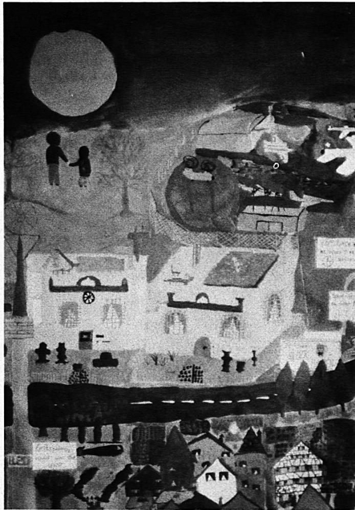
Momo und Gigi unter dem Mond.