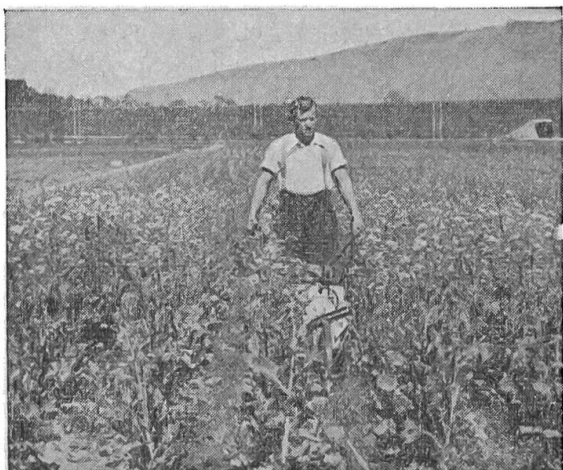
Cliché der Firma

Unter welchen Umständen soll nun eine Differential- oder Gelenkwelle, Achsschenkel, Radlenker usw., die einem Abbruchfahrzeug entnommen wurden, wieder eingebaut werden, damit die Fahrsicherheit trotzdem den gewünschten Grad erreicht? Wenn solche Teile unvermeidlich bezogen werden müssen, weil sie neuwertig weder bezogen noch angefertigt werden können, so ist vor der Montage unbedingt eine Untersuchung auf Riss und Bruch vorzunehmen! Eine äusserliche Untersuchung mit der Lupe überzeugt aber nicht, da auf diese Weise ein bevorstehender Dauerbruch in den seltensten Fällen entdeckt werden kann. Der Dauerbruch hat es an sich, dass er selbst kurz vor seinem endgültigen Durchbruch den gewöhnlichen äusserlichen Untersuchungsmethoden entgeht. Zu empfehlen ist eine magnetische Untersuchung , wie sie z. B. von der eidg. Materialprüfungsanstalt vorgenommen wird. Die Teile sind zuerst zu reinigen und womöglich zu polieren, dann werden sie in einem Bad mit suspendierten Eisenpartikeln stark magnetisiert und es zeigt sich der Verlauf eventueller Risse in Form von schwarzen Linien, da