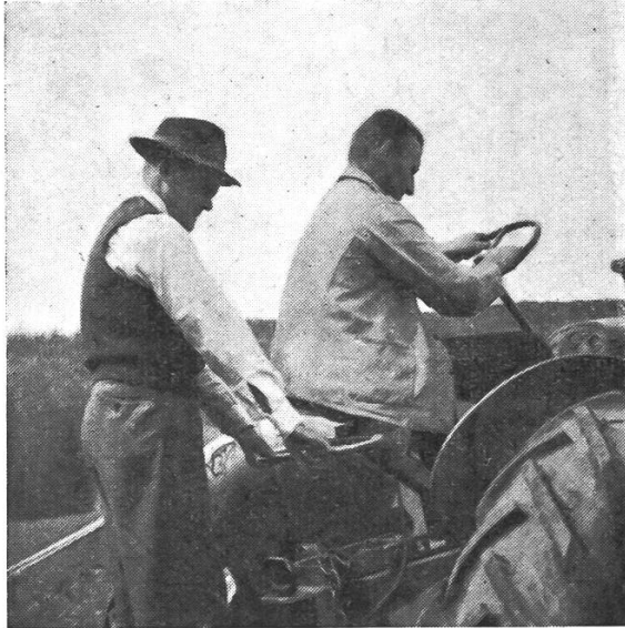
Bequeme und robuste Haltevorrichtung für Mitfahrer am Traktor «Case» VS (Allamand Ballens).

Das Bild 1 zeigt eine gute Haltevorrichtung für das mitfahrende Personal, das hinten auf der Plattform steht. Die Handgriffe müssen so gestaltet sein, dass sich der Mitfahrer mit beiden Händen kräftig halten kann. Das mit einer Hand zu machen und dazu noch Werkzeuge, womöglich offene Sensen mitzutragen, das ist mit dem Tod gespielt.