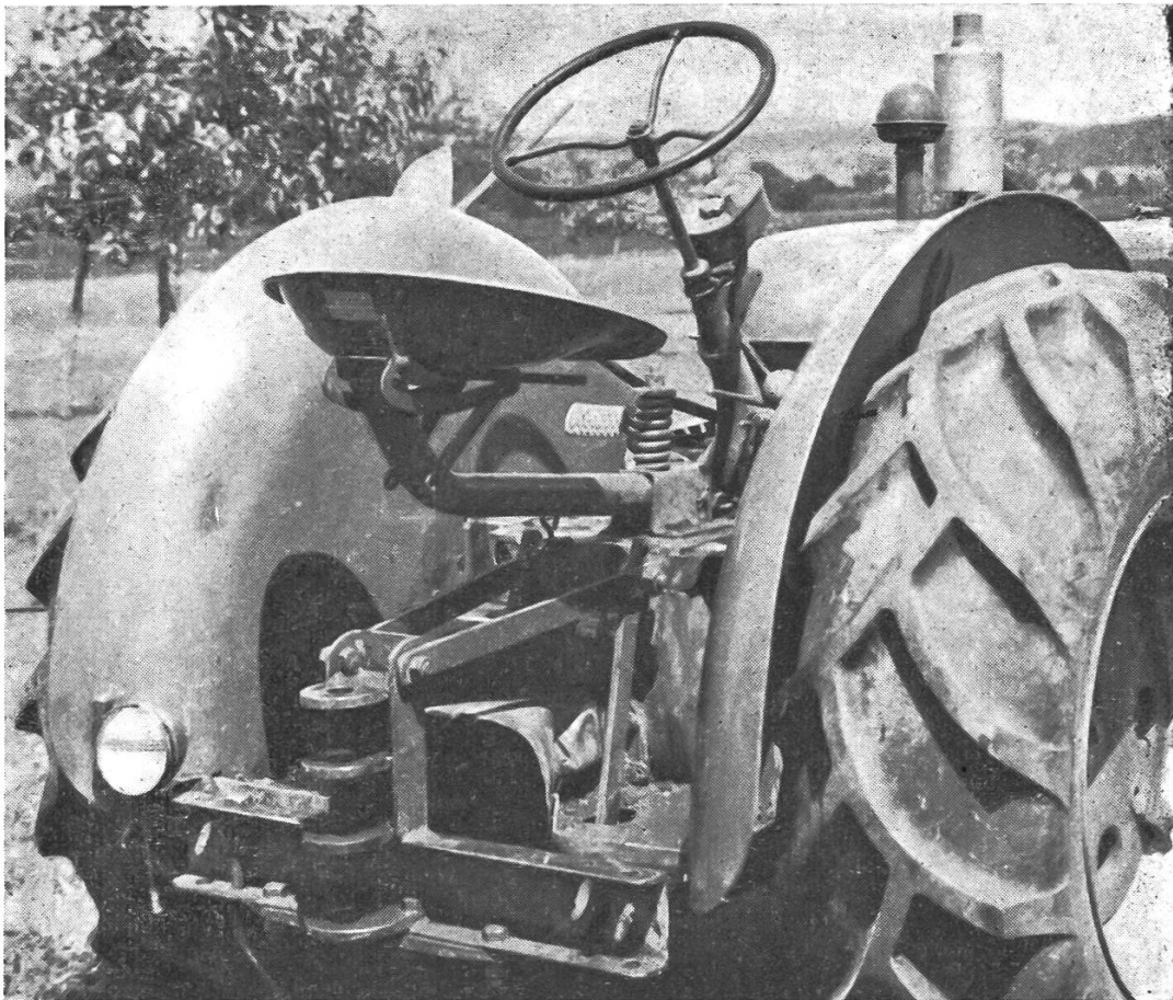
Abbildung 2: Einwandfreie Kotflügel am IHC-Traktor, Typ: W 4.

Es dürfte bei diesem Anlass erwähnt werden, dass die Firma Meili in Schaffhausen am letztjährigen Comptoir und an der «Züka» eine gute und praktische Haltevorrichtung für Mitfahrer ausgestellt hat (s. «Traktor» Nr. 10/47). Die auf dem Bild 1 hievor abgebildete Haltevorrichtung stammt von der Firma Allamand in Ballens (Vd.), Importeur des Traktors «Case». I.