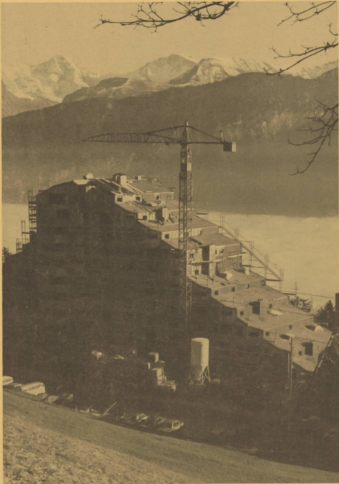
Apartementhotel Blüemlisalp mit 160 Eigentumswohnungen, Beatenberg.

L'hôtel «Blüemlisalp» du Beatenberg: 160 appartements privés.