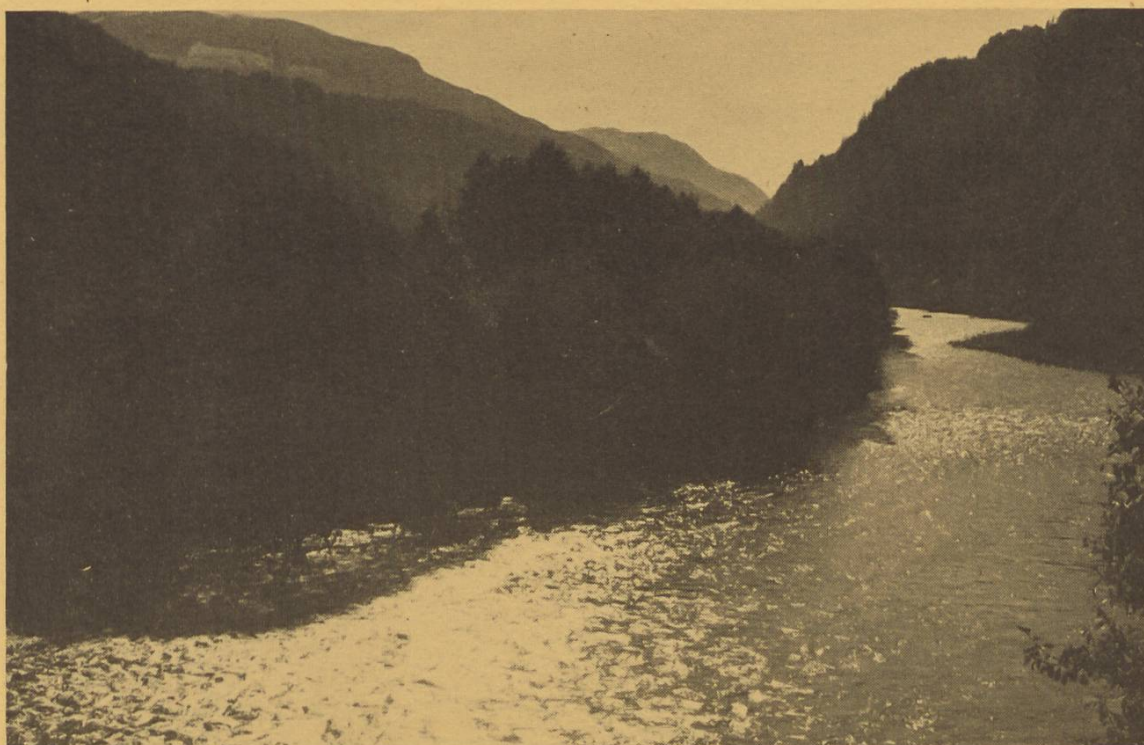
Der Vorderrhein zwischen Ilanz und Tavanasa heute, bei mittlerer Wasserführung. Le Rhin antérieur entre Ilanz et Tavanasa, un jour de débit moyen.