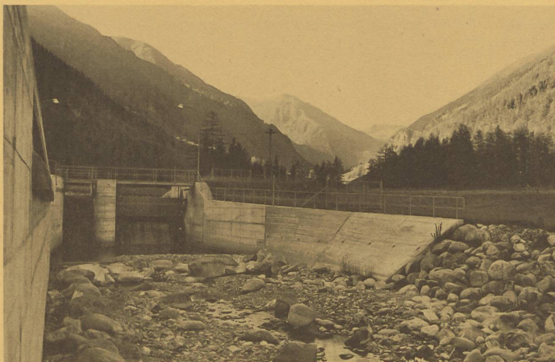
Etwa so wird sich der Vorderrhein nach dem Bau von Ilanz I jeweils während vieler Monate des Jahres präsentieren. (Bild: Wasserfassung Vallember, Engadin)

C'est ainsi que l'on peut imaginer le Rhin plusieurs mois par an après la constructions du barrage de Ilanz I. (Foto: Prise d'eau Vallember, Engadine)