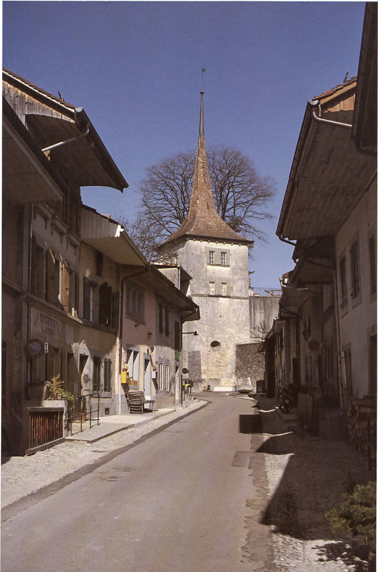
Moudon: la haute ville