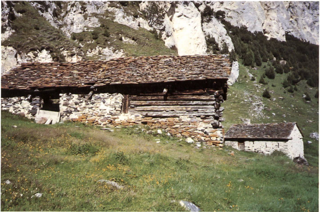
«Alp Pozzetta e Cascina dell'Ör», Lukmanier