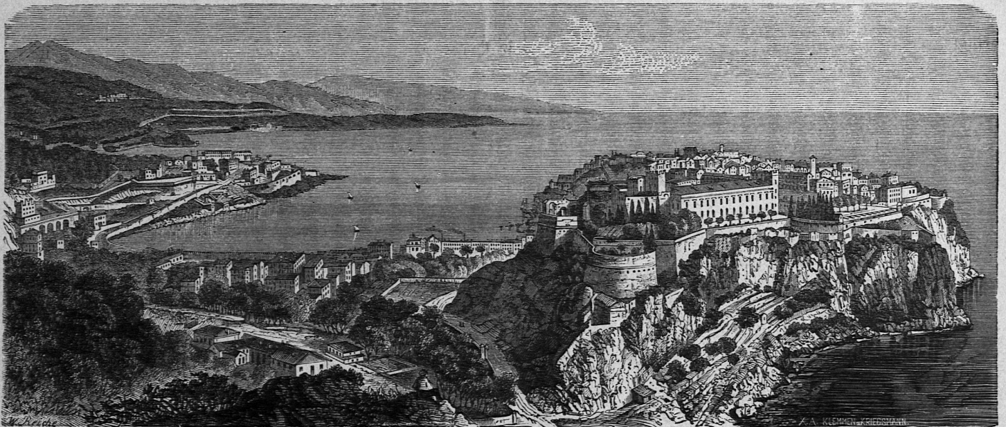
Monaco, Fürstenthum und Stadt.

Der fünfte Jahrgang beginnt mit dem Monat Oktober. Unsere Zeitschrift ist kein gelehrtes Fachblatt, sie hat vielmehr das Ziel „Geographisches Wissen, das heutzutage für jeden Gebildeten von der größten Wichtigkeit ist, durch vielseitige und gediegene Mittheilungen über alle Theile der Welt, in allgemein verständlicher, ansprechender und unterhaltender Form, sowie durch gute Illustrationen und Karten in den weitesten Kreisen zu verbreiten“.