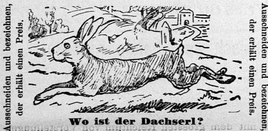
Wo ist der Dachserl?

Der Verlag des „Spiritist“ stellt, um die Zeitschrift zu verbreiten, an seine neuen Abonnenten nachstehendes Vexirbild und setzt für die richtige Lösung desselben obenstehende Preise aus. Jeder richtige Auflösung erhält also eine Prämie bestimmt. Dafür garantieren wir, und diejenigen Abonnenten, die keine Preise erhalten, bekommen ihr einbezahltes Abonnementgeld zurück und die Zeitschrift „Der Spiritist“ gratis.