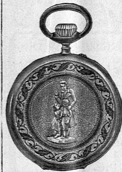
3/4 nat. Grösse

In Verbindung mit der seit 1881 bestehenden Privat-anstalt für erholungsbedürftige Kinder. (H 3022 Lz) [O V 569] Besitzer; Hürlimann, Arzt, Erziehungsrat.