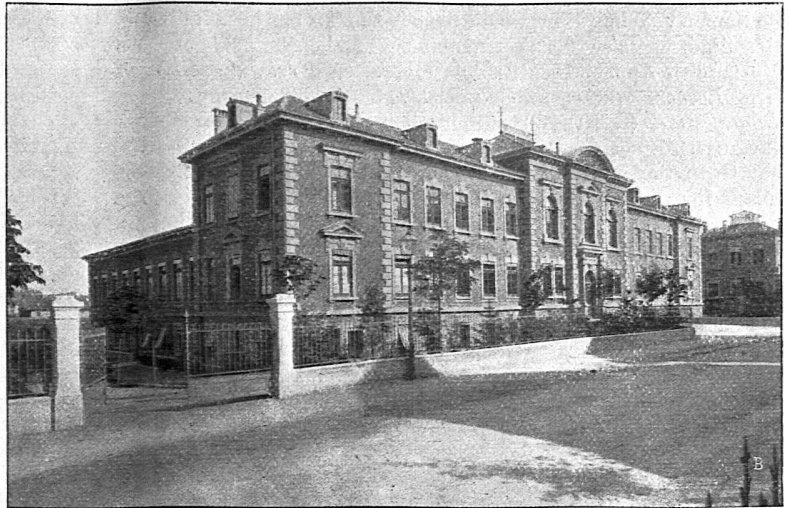
Anatomiegebäude der Universität Bern.

6. Die siebente und achte Klasse mit reduzierter Unterrichtszeit im Sommer dürfen im Sommersemester während höchstens vier Stunden mit andern Klassen vereinigt werden.