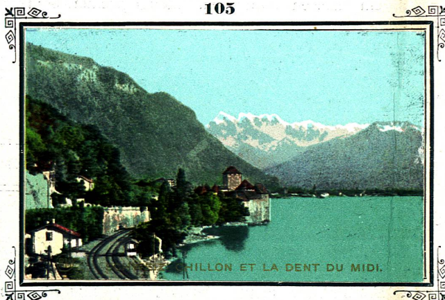
Uraltres Schloss, schon im 9. Jahrhundert vorhanden. Im 13. Jahrhundert von Peter von Savoyen ausgebaut. Von 1530—1536 schmachtete hier im unterirdischen Kerker der edle Genfer Bonnard.

Vom pädagogischen Standpunkte aus und, um auch das Auffinden eines im Photocol dargestellten Ortes auf der Karte zu erleichtern, suche man stets die Nummer 1, welche in der Regel die Hauptstadt trägt, zunächst auf und verfolge von da solange die fortlaufenden Nummern, bis der betreffende Punkt gefunden ist. Auf Reservbilder lässt sich dieses Verfahren nicht anwenden, da diese auf der Karte keine Nummer tragen.