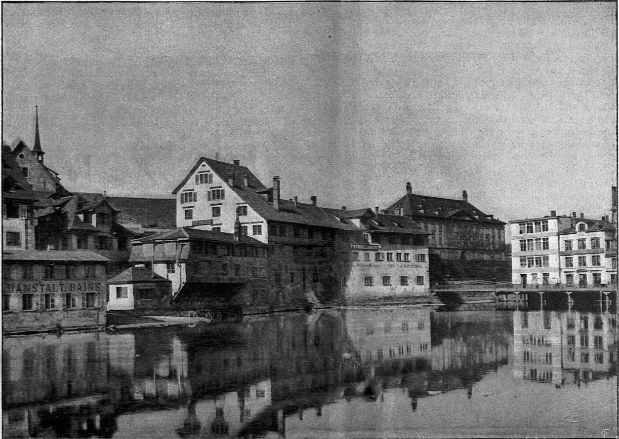
Ansicht des Pestalozzianums.

Inhalt: Zur Einführung. — Vom Pestalozzianum. — Ein Gang durch das Pestalozzianum in Zürich. — Erwerbungen.