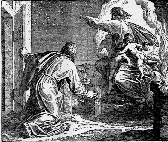
Schnorr von Carolsfeld: Abraham empfängt die Verheissung.