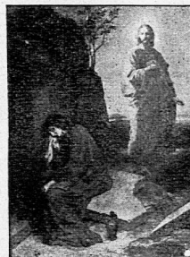
Hofmann: Jesus und die Samariterin.