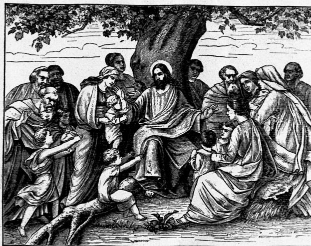
Wangemann: Der Heiland segnet die Kinder.

Wandkarten: Algermissen, J. L. Palästina zur Zeit Jesu Christi. 1 : 250000. 120/136 cm. 8. Auflage. Leipzig, G. Lang.