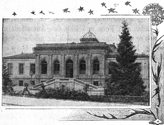
Bernoullianum in Basel.