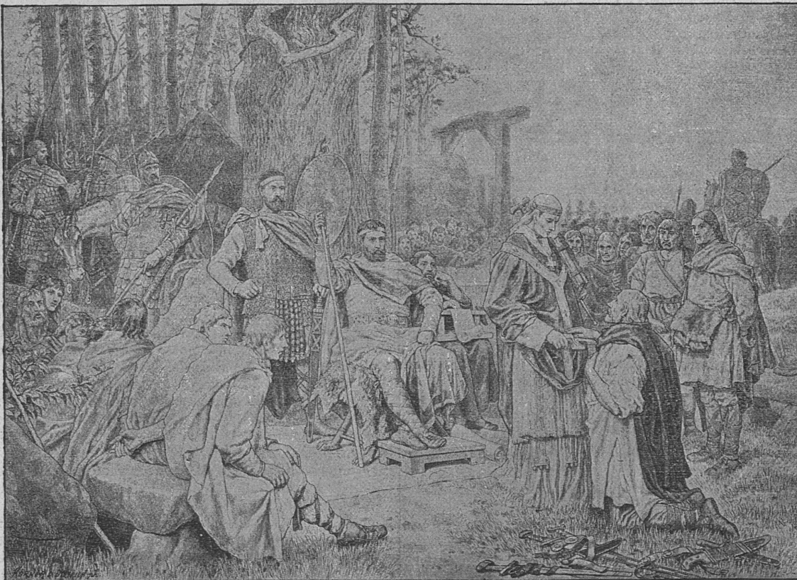
Lehmann, A.: Sendgrafengericht.

Hemmlé, H. Wandbilder zur Anschauung für die alte und neue Geschichte. 25 Tafeln in Farbendruck. 60/49 cm. Preis mit Text 28 Fr. Inhalt: Blatt 1 und 2: Ägypter, 3—6: Hebräer, 7 und 8: Babylonier, Assyrer, Perser, 9 und 10: Römer, Makedonier, Griechen, 11: Germanen, 12: Gallier, Skythen, 13: Hunnen, 14: Goten, Longobarden, 15: Franken, 16: Ritter, 17: Landsknecht und Bauer, 18: Dreissigjähriger Krieg (Schweden), 19 und 20: Dreissigjähriger Krieg (Kaiserliche), 21: Friedrich Wilhelm, 22 und 23: Siebenjähriger Krieg, 24: Befreiungskriege, 25: Mönch und Nonne.