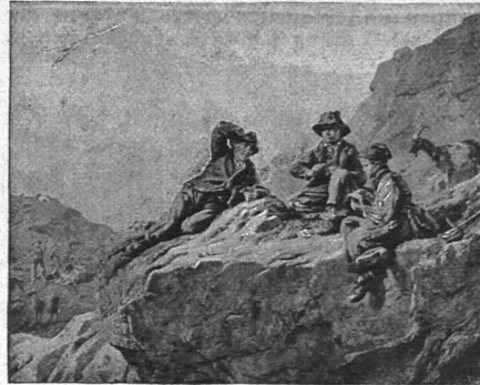
Spiel ohne Gewinn.

Zwei prachtvolle Gemälde (Format 54 x 66 cm), feinste Lichtdruckausführung, werden der schweizer. Lehrerschaft, sowie den werten Lesern der „Schweiz. Lehrerzeitung“ zum Preise von Fr. 3.75 beide Exemplare zusammen offeriert. Versand franko durch die ganze Schweiz. Zu beziehen vom Verlag Fritz Meyer, Buchhandlung, Zürich, Gessnerallee 38.