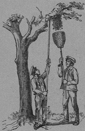
Einfangen des Schwarmes (Aus Beilage: „Bienenzucht“)

6 Bände in Halbleder gebunden zu je 16 Frs.