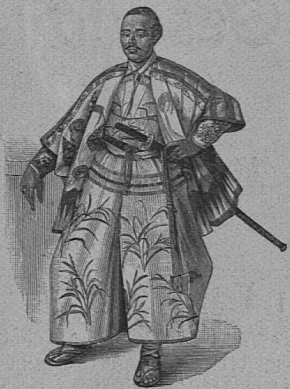
Vornehmer Japaner. Anfang des 17. Jahrhunderts. (Aus Tafel: „Japanische Kultur und Kunst I“)

Ein Konversations-Lexikon darf in keinem Hause mit geistigen Interessen fehlen. Der „Kleine Meyer“ entspricht den Anforderungen jener weiten Kreise, die nicht immer Lust und Zeit haben, um einer flüchtigen Auskunft oder kurzen Belehrung willen einen längern Artikel durchzulesen. Die neue Auflage des ehemals dreibändigen Werkes, die wegen des ungeheuer angewachsenen Stoffes auf sechs Bände gebracht wird, gibt in 130,000 Artikeln auf jede Frage eine klare, bündige Antwort und wird dadurch zu einem gewissenhaften Führer in dem Labyrinth der Ereignisse, Entdeckungen, Erfindungen und Umwälzungen unserer bewegten Zeit. Durchaus volkstümlich geschrieben, unterstützt von einem ebenso reichhaltigen wie künstlerischen Illustrationsapparat, weiß dieses vorzüglich ausgestattete Nachschlagebuch für jedes Vorkommnis eine Erklärung, auf jeden Zweifel einen Bescheid, in jedem Streit eine Entscheidung, für jeden Notfall einen Behelf.