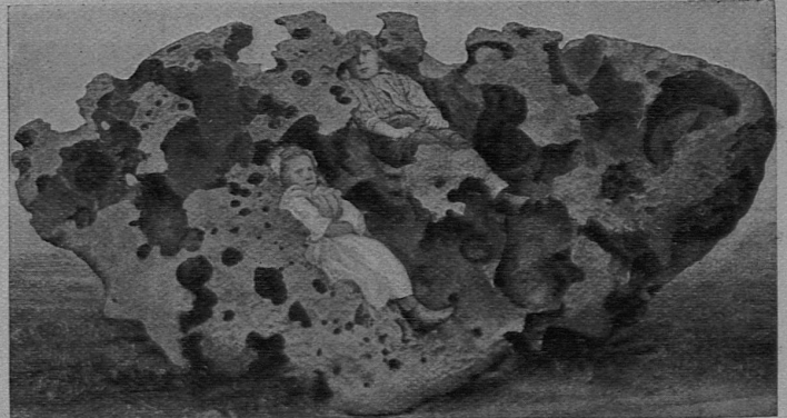
Das Eisen von Oregon. Nach Photographie

Nach einer Betrachtung über das Wesen der Himmelskunde und einer Übersicht der astronomischen Hilfsmittel wird im ersten Hauptteil die Beschaffenheit der Himmelskörper, das Planetensystem und die Welt der Fixsterne einer eingehenden Schilderung unterzogen. Der zweite Hauptteil dringt in die Erkenntnis von den Bewegungen der Himmelskörper ein und behandelt erst die scheinbaren, darauf die wirklichen Bewegungen der Planeten und Fixsterne. Eine Entwicklungsgeschichte der Weltkörper schließt das Buch ab, in dem zum erstenmal ohne Voraussetzung wissenschaftlicher Fachkenntnis ein klares Bild von dem innern Zusammenhang des ganzen Weltgebäudes gegeben wird.