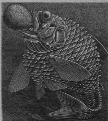
An die Meeresoberfläche gezogener Tiefseefisch, dessen Speiseröhre und Schuppen infolge des verringerten Luftdrucks herausquellen