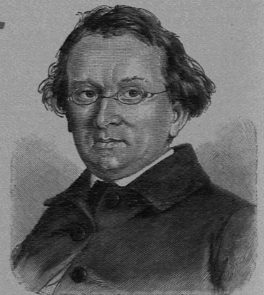
Ed. Mörike.