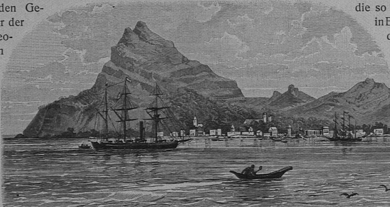
Die Insel Mangarewa der Tuamotugruppe

in Einzellandschaften geschieden, so daß diese mit ihren Völkern, deren Siedlungen, Verkehrswegen und wirtschaftlichen Verhältnissen als organische Einheiten erscheinen. Dem Werk sind vorzügliche Karten im Text und auf besondern Tafeln sowie typische Landschaftsbilder in Schwarz- und Farbendruck beigegeben. Jeder Band hat ein ausführliches Sach-