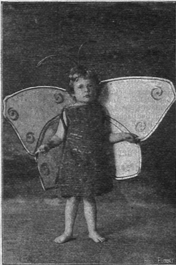
Der Schmetterling. Aus „Frühlings-Einzug“.

Märchenszene a. d. gleichnamigen 3-aktigen Märchenspiel. (31 Seiten, 8 o ) — .60 Klavierauszug dazu 3. —