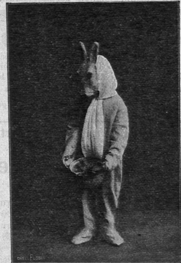
Hase Schnuppennase. Aus „Ein Küchenabenteurer“.

Verlag: Art. Institut Orell Füssli Zürich