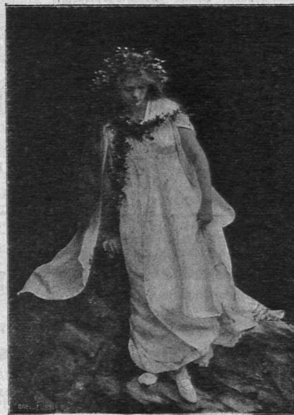
Das Märchen. Aus „Das Goldkrönlein“.

Kleines Lustspiel für 20 Kinder von 6—12 Jahren. (19 Seiten kl. 8 o mit 1 Abbildung.) — .50