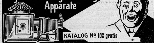
KATALOG N° 102 gratis