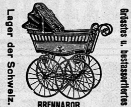
Lager der Schweiz.