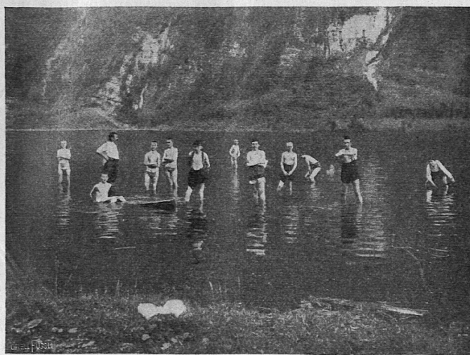
Fussbad im Klöntalersee.

Dass solche mehrtägige Wanderungen mit Schülern der Volksschule durchgeführt werden können, steht fest. Seit 1911 organisiert der Lehrerturnverein Zürich Ferienwanderungen für Schüler der 1. bis 3. Sekundarklasse und der 7. und 8. Klasse; die Lehrerturnvereine Winterthur und St. Gallen folgten nach; vereinzelt Kollegen führten da und dort ähnliche Wanderungen aus; von überall her lauten die Berichte günstig. Leiter und Schüler sind für die neue Art des Wanderns begeistert, der Grossteil der Lehrerschaft aber verhält sich ablehnend. Es lohnt sich, den Gründen hierfür nachzugehen. Sage mir niemand, die Lehrerschaft kenne den grossen Wert mehrtägiger Wanderungen nicht; ihre pädagogische hygienische und nationale Bedeutung müssen ja einleuchten. Es kann darum auch nicht Zweck dieser Arbeit sein, auf alle diese Punkte näher einzugehen. Eine reiche Literatur gibt hierüber erschöpfenden Aufschluss; sie findet sich angegeben in dem trefflichen Büchlein von Raydt und Eckardt „Das Wandern“. Verlag B. G. Teubner, Leipzig, M. 1.20. Nur auf eines sei noch hingewiesen. Deutsche Ärzte haben den Einfluss mehrtägiger Wanderungen auf die körperliche Entwicklung der Volksschuljugend untersucht und sind dabei zu dem überraschen-