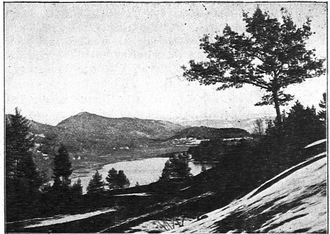
Vorfrühling am Türlersee. Blick vom Augsterberg gegen Süden. Erklärung: (Vorfrühling) Türlersee, Türlen, Riedmatt, Oberalbis mit Bürglenstutz, Alpenkette.

3. Am 6. Juni begannen wir das Hauptwerk! Der Lehrer brachte uns einen Plan, der doppelt so groß war als die an-