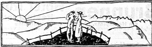
Eine der schönsten Reisen ins Herz der Schweiz

Schöne Räumlichkeiten für Schulen, Vereine und Gesellschaften. Gute Unterkunft für Touristen u. Passanten. Gutbürgerliche Küche. Reelle Weine. Freundl. Zimmer. Teleph. 185. Höflich empfiehlt sich: Ad. Locher-Bernet.