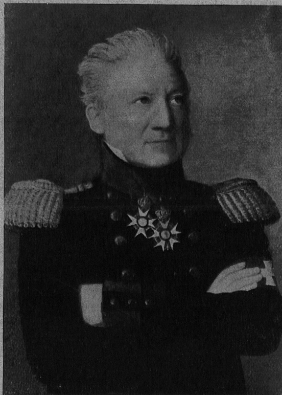
JOHANNES HERZOG, 1773—1840, Gemälde von Diogg, im Besitze von Frau J. Bally-Herzog, Schönenwerd.

Weise abzulösen. Für Herzog ist charakteristisch, dass er wiederum mitzuwirken hatte, als durch ein Gesetz die Ausnahmestellung der Juden aufgehoben werden sollte. Im Kriegsjahre 1799 amtierte der junge Staatsmann und Offizier als helvetischer Kommissär in St. Gallen, um kurz darauf in ähnlicher Stellung dem Hauptquartier Massenas zugeteilt zu werden. Eine neue Aufgabe erwartete ihn in Graubünden, dessen Anschluss an die helvetische Republik er vorzubereiten hatte. — Inzwischen war die französische Armeeführung auf den tatkräftigen, gewandten Schweizer Offizier aufmerksam geworden; sie bot ihm das Brevet eines französischen Brigadegenerals an! Er lehnte ab, aber ein Kommissariat bei der französischen Rheinarmee hielt ihn bis in den Herbst 1800 von den Verhandlungen der helvetischen Räte fern, während sein Mandat als