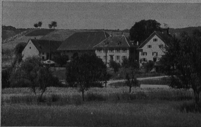
Das Stammhaus der Familie Herzog (Hauptgebäude rechts) in Effingen, heute Erziehungsanstalt für Knaben.

Der Schmerz überwältigt mich, indessen ich Ihnen diese traurige Nachricht mittheile, aber in der Zerrissenheit meines Herzens wage ich es dennoch, Sie um der Freundschaft willen, womit Sie meinen seligen Vater beehrten, zu bitten, uns fernerhin das hohe Wohlwollen zu schenken, um das Sie der Sterbende selbst so gerne für uns hätte ansprechen mögen.