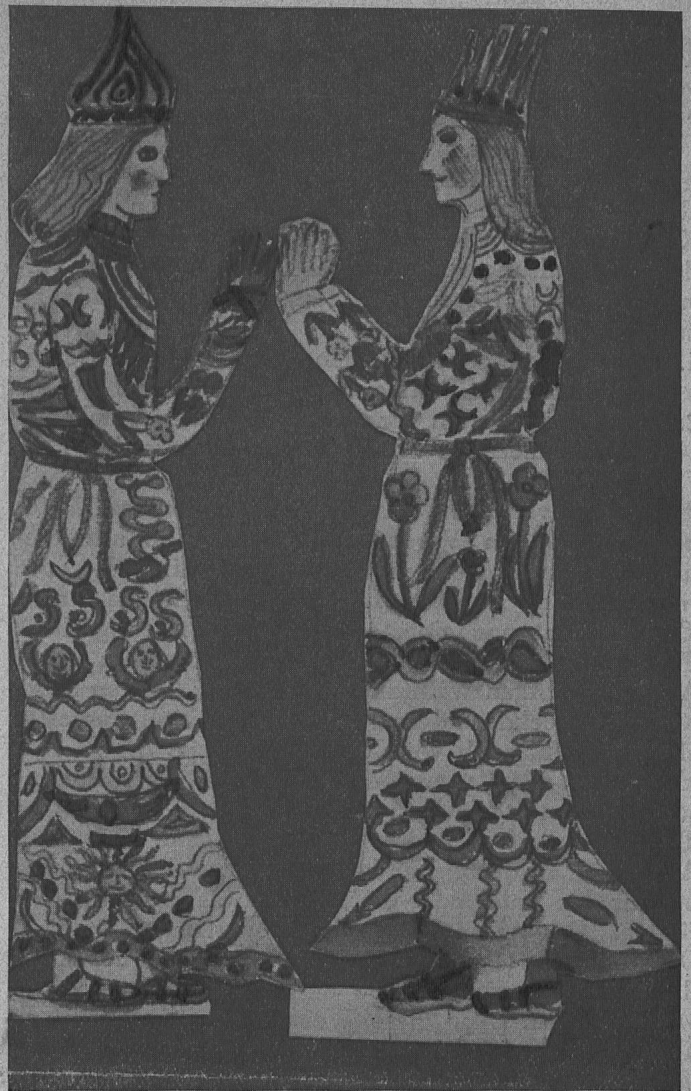
Krippefiguren einer Elfjährigen.