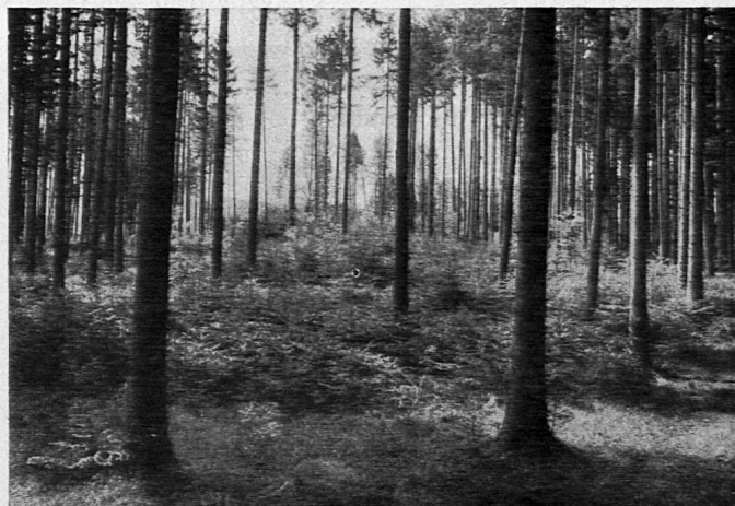
Boswil. Kahlschlag im reinen Nadelholzbestand.

Eine weitere Aufgabe hat der Wald im Gebirge zu erfüllen. Er gewährt Schutz gegen verderbliche Naturereignisse verschiedenster Art. Er bekleidet die Steilhänge und verhindert das Abrutschen der fruchtbaren Bodenschicht auf der Gesteinsunterlage. Er verzögert den Abfluss von Regen- und Schmelzwasser und gleicht damit den Wasserhaushalt unserer Quellen, Bäche und Flüsse stark aus. Der Wald verhindert ferner die Entstehung von Lawinen und bietet Schutz gegen