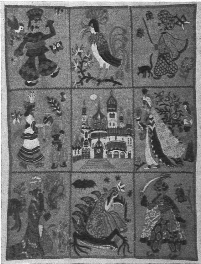
Wandteppich. Gemeinschaftsarbeit fünf begabter Schülerinnen (11. Altersjahr). Leiterin: Irma Weidmann, Zürich-Seebach.

und diese wuchs, als alle andern sich auch daran freuten. — «So mög's im Saal blüje johrus und i!» Ich beobachtete, wie dies und jenes Mädchen den Weg zu einer Kameradin fand, als es öfters deren Kunstwerklein bewunderte. Gemeinschaftssinn und Zusammenschluss wurden in dieser Klasse um vieles verstärkt.