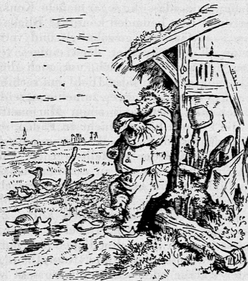
Richter-Bild: Der Igel vor dem Hause.

Dürfen sie aber auch gezeichnet werden? Sicher ist, dass sie das Kind zeichnen will. Da ihm die Bildgestaltung frei steht, wird seiner Phantasie keinerlei Zwang angetan. Wie ist es aber, wenn ihm Erwachsene fertige Märchenbilder vorlegen, sei es in Gestalt eines künstlerischen Buchschmuckes, eines guten Wandbildes oder einer Wandtafel-skizze? Wird hier die Phantasie des Kindes nicht verletzt? Die Erfahrung lehrt, dass das Kind selten solche Darstellungen ablehnt, sondern sie im Gegenteil allgemein begrüsst, ja sogar verlangt. Die Wandtafel-skizze wie die künstlerische Darstellung sind ihm gleich lieb;