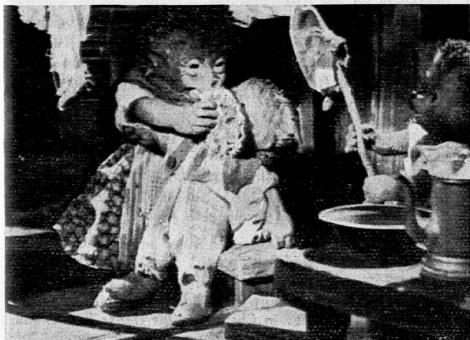
Filmbild: Die Igelfamilie.

Mögen recht viele Lehrer unbefangen nach diesem neuen Filme greifen, um ihn unterrichtlich zu bewerten oder als reinen Freudespender vorzuführen!