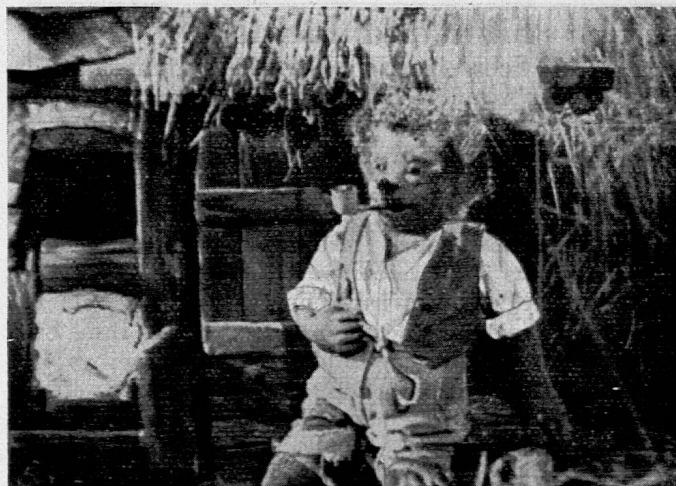
Filmbild: Der Igel vor dem Hause.