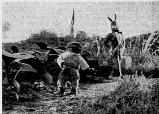
Filmbild: Hase und Igel.

Wie aber war dieser Puppenfilm möglich, von dem geschrieben wurde, «dass ihn sogar manche Konkurrenz aus Fleisch und Blut beneiden könnte»? Blicke hinter die Kulissen enttäuschen gewöhnlich und verderben die Illusion. Wenn wir hier doch einiges verraten wollen, so tun wir es lediglich, um auch die technische Leistung der Gebrüder Diehl ins rechte Licht zu rücken. Um Irrtümer vorweg zu nehmen, sei betont, dass es sich hier nicht um einen Marionettenfilm handelt. Die Puppen hängen nicht an Fäden, sondern stehen auf dem Boden. Die Bewegung entsteht dadurch, dass ihre Glieder verstellt werden. Um eine möglichst flüssige Bewegung zu erhalten, musste für jedes Filmbildchen eine neue Aufnahme gemacht werden. Da in der Sekunde 16 Filmbildchen ablaufen, mussten also für diese unglaublich kurze Zeit 16 Aufnahmen gemacht werden. Dabei war darauf zu achten, dass je nach der Schnelligkeit der darzustellenden Arm-, Kopf-, Bein- und Rumpfbewegungen die Glieder stärker oder schwächer verstellt werden mussten. Rasche Bewegungen verlangten stärkere Unterschiede in der Stellung als langsame. Wie sorgfältig diese Aufnahmen vorbereitet wurden, erhellt unter anderem daraus, dass man zuerst einen springenden Menschen filmte, um ein untrügerisches Vorbild für das springende Hasenmännchen zu haben. — Das Wunderbarste aber an diesem neuen Puppenfilm ist das Mienenspiel; denn es verleiht dem Filme die Seele. Um es zu erreichen wurden die Züge des Ge-