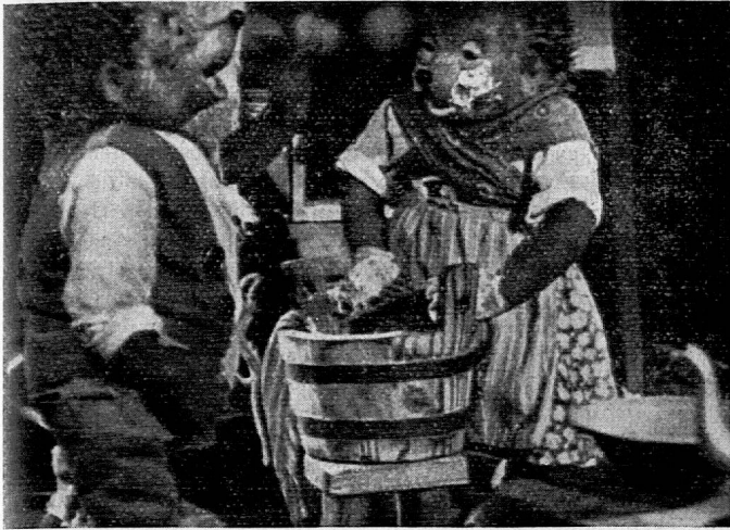
Filmbild: Igelmann und Igelfrau.

sichtes umgeformt. So kommt es, dass uns heute die Puppen wie fleischgewordene Wesen ansehen, dass sie lächeln, blinzeln.