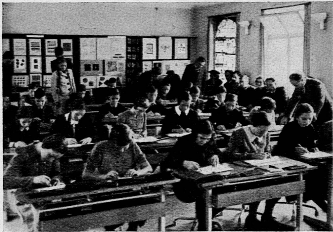
Eine Zeichenstunde im Neubau.

Ueber die Herbsttagung im Tessin (7.—11. Oktober) ist in einer früheren Nummer des «Pestalozzianums» ausführlich berichtet worden. Hier soll nur