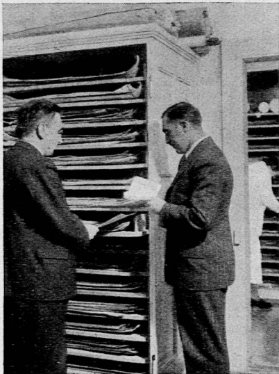
Die Bildersammlung umfasst ca. 8000 Schulwandbilder.