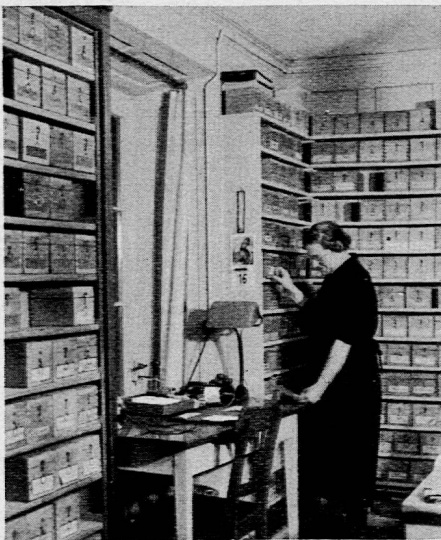
Die Lichtbildersammlung zählt ca. 500 Serien mit insgesamt ca. 10000 Bildern.