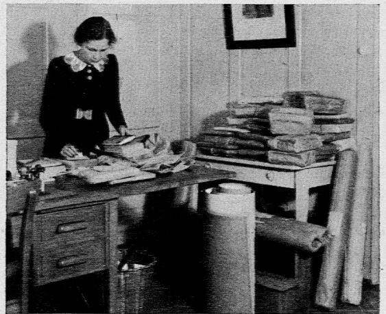
Bücher- und Bildersendungen kommen zurück.

Die Pestalozziforschung ist in unserem Institut vor allem durch die Vorbereitung der Briefsammlung