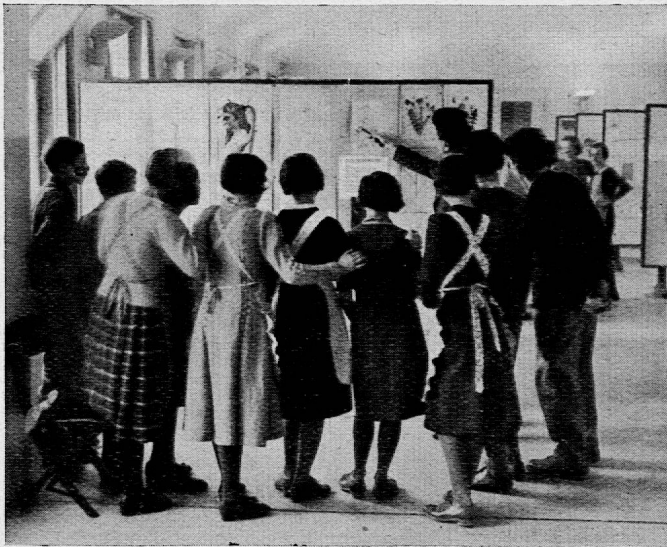
Eine Schulklasse besichtigt die Zeichenausstellung im Neubau.

Die Jugendbühne im Neubau fand auch im Berichtsjahr Zuspruch. Es kamen zur Aufführung: «Schwan, kleb' an!» (Rud. Hägni), «Gustav, der Waisenknabe» (Gottfr. Hotz), «d'Stross» (Oberschule