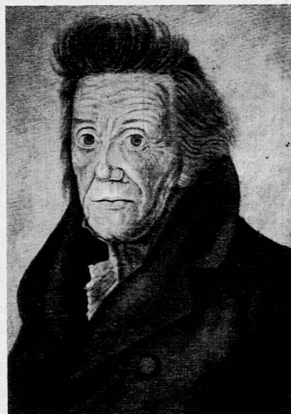
Joh. Hch. Pestalozzi