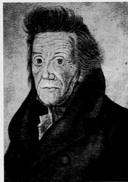
Joh. Hch. Pestalozzi