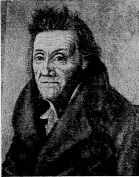
Joh. Hch. Pestalozzi