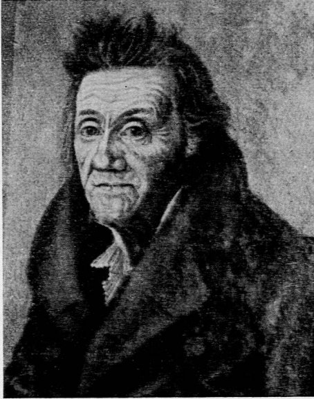
Joh. Hch. Pestalozzi