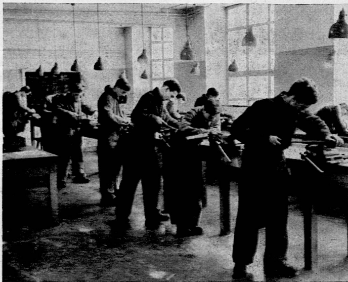
Werkjahr für Jugendliche. Kursteilnehmer an der Arbeit.