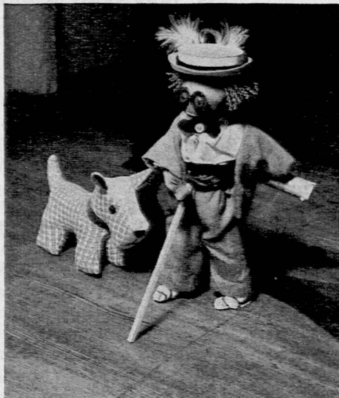
Selbstgemachtes Spielzeug. Stoffpuppen und -Tiere.