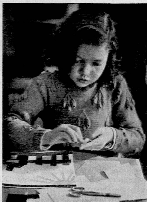
Selbstgemachtes Spielzeug. Kinder kleben ein Bilderbuch.

Nahmen so die äusseren Veranstaltungen einen erfreulichen Verlauf, so darf auch auf eine befriedigende Entwicklung der internen Tätigkeit hingewiesen werden. In Bibliothek und Lesezimmer zählten wir im ganzen 6168 Besucher (4610 aus der Stadt Zürich, 1217 aus dem übrigen Kanton und 341 aus andern Kantonen). Die Bibliothekskommission, die über die Anschaffungen für unsere Bücherei entscheidet, hat in sechs Sitzungen ihre Vorschläge bereinigt. Es sind 1017 Bände in unsere Bibliothek eingereicht worden — Doubletten nicht gerechnet — die, als grösste pädagogische Bibliothek unseres Landes, nunmehr etwa 75 000 Bände zählt.