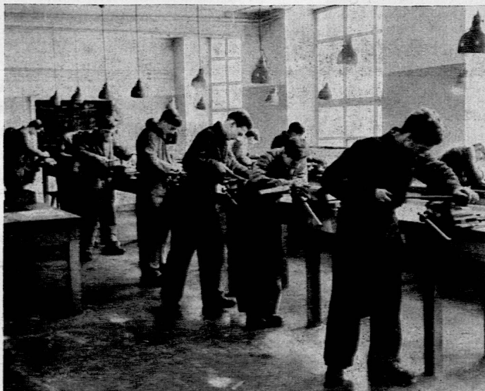
Werkjahr für Jugendliche. Kursteilnehmer an der Arbeit.