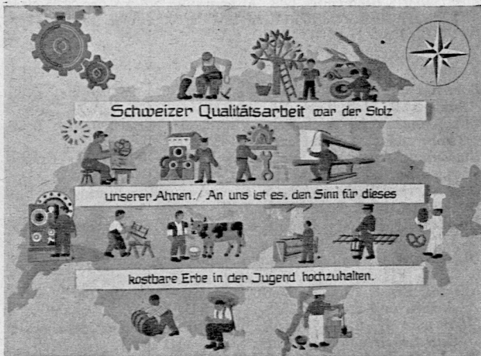
Aus der Ausstellung „Kopf und Hand“.

Die Pestalozziforschung wird immer eine wesentliche Aufgabe unseres Instituts sein. Zwar hat der Krieg die Weiterführung der grossen kritischen Ausgabe der Werke Pestalozzis ausserordentlich gehemmt. Erst dieser Tage ist Band 18 zur Ausgabe gelangt, nachdem seit Einreichung des Manuskripts mehr als