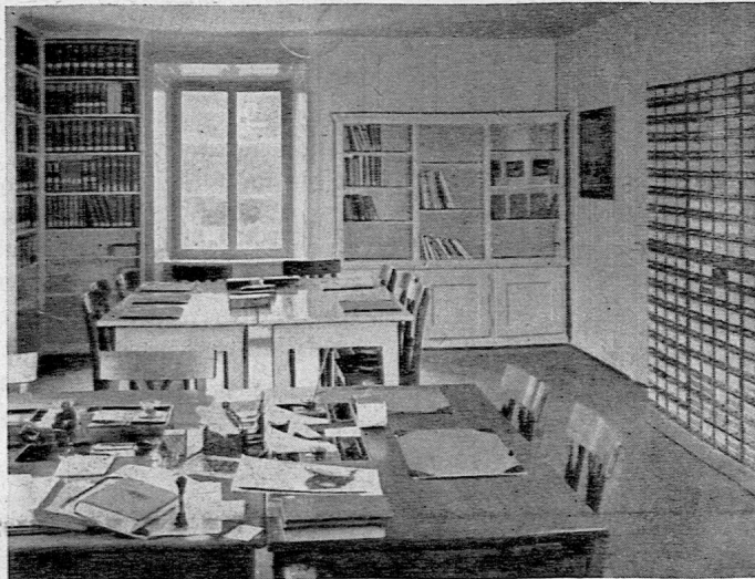
Der erweiterte Raum für Bücherausgabe und Kataloge.

Die Bibliothek unseres Instituts fand auch im Berichtsjahr einen recht grossen Zuspruch. Wenn die