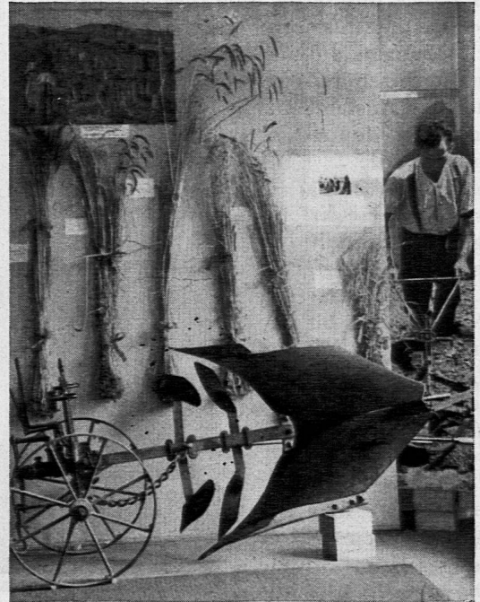
Aus der Ausstellung «Zeitgemässe Ernährungsfragen im Unterricht» Gruppe: «Unser Brot».