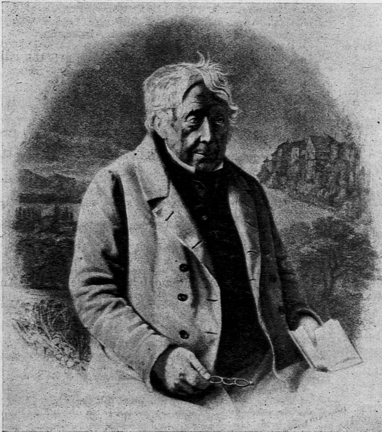
Christian Lippe (1779–1853)

Bei solch verschieden gearteten Charakteren war auf die Dauer kein erspriessliches Zusammenarbeiten