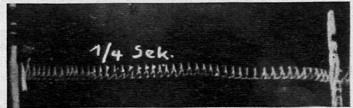
Fig. 2: Aufzeichnung eines schwingenden Bienenflügels auf eine bewegte Russplatte: 45 bis 46 Schwingungen in \frac{1}{4} Sekunde. Natürliche Grösse.

Ist diese Arbeit gelungen, werden die Marken der Viertelsekunden vom Papier auf die Russplatte übertragen; die gemeinsamen Startlinien erlauben ein recht genaues Abmessen. Die so bearbeiteten Platten halten wir gegen das Fenster oder vor eine Lampe und vermögen von blossen Auge oder mit einer einfachen Handlupe die Schwingungen zu zählen. Als Russplatten eignen sich auch Deckgläser für Diapositive, die bei guten Versuchsergebnissen mit Schellack oder Zaponlack fixiert werden. Mit Hilfe eines Projektionsapparates können die Versuchsergebnisse vor der ganzen Klasse besprochen und ausgewertet werden.