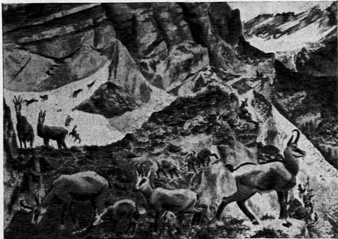
Maler: Robert Hainard, Bernex-Genève.

Beim Kommentar zum stimmungsvollen Tessiner Landschaftsbild (das Motiv stammt aus Losone bei Locarno) der Rosetta Leins , Ascona, zum Thema Kind