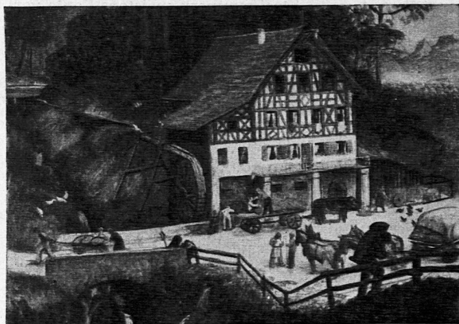
Maler: Reinhold Kündig, Horgen

Die hier schon einmal ausführlich angezeigte XI. Bildfolge des SSW — wie offiziell das Schweizerische Schulwandbilderwerk benannt wird — ist abgabebereit. Seit Jahren wird immer wieder vergeblich versucht, den am grünen Tisch ausgeheckten Termin kalender einzuhalten, um im Juli mit dem Versand der Bilder beginnen zu können, inbegriffen die Kommentare, die gleichzeitig abgehen müssen. Trotzdem ist eine «kleine Verspätung» von fast zwei Monaten längst Tradition geworden. Meist waren die Kommentare