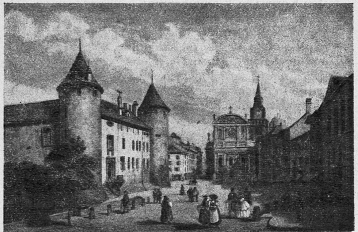
Platz und Schloss Yverdon

1804 war Pestalozzi als fast sechzigjähriger Mann mit einigen Zöglingen nach Yverdon gezogen, um im alten Schloss ein Institut zu eröffnen; 1825 schloss dieses seine Pforten und Pestalozzi, nunmehr achtzig Jahre alt, zog sich auf den Neuhof zurück. Dazwischen liegen zwanzig Jahre regen Schaffens, in welchen das Institut zu einer der bekanntesten Bildungsstätten Europas wurde und Zöglinge aus den verschiedensten Ländern ihm zuströmten.