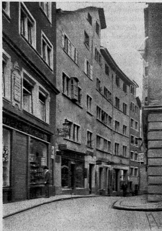
Haus zum roten Gatter an der Münsterergasse, in dem Pestalozzi seine Jugendzeit verlebte

Ja, gewüss werden Deine Umarmungen, gewiss wird Deine zärtliche Güte einen Einfluss auf meine Seele haben, der grösser syn wird, als Du velleicht noch nicht selbst hoffest.» (Seite 13.)